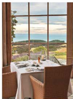
El resort cuenta con The Farm, una perfecta área de descanso y vasta atención.

Con una dimensión de 6,510 metros (7,119 yardas), está considerado como una de las maravillas modernas del golf. En el 2008 y 2009 se organizó el torneo Kivi Challenge del PGA Tour, donde cuatro de los mejores jugadores y finalistas estadounidenses apenas llegaban a la veintena de edad: Hunter Mahan, Anthony Kim y Sean O'Hair.