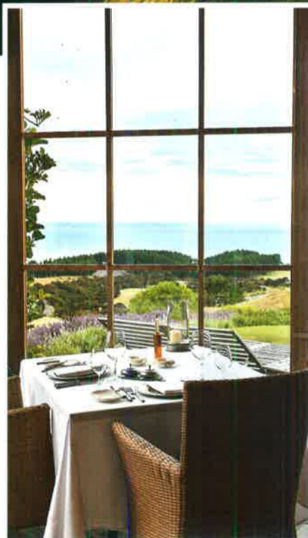
Distinguidos chefs de todo el mundo frecuentan las cocinas de Cape Kidnappers.